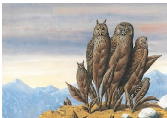
Les compagnons de la peur - René Magritte - 1942